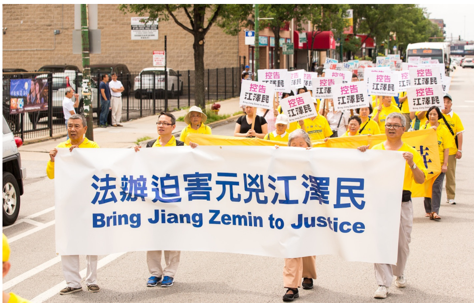
图：来自中部十个州的法轮功学员，齐聚芝加哥中国城举行盛大的游行。

随后，美中各州的学员还在中领馆前集体炼功，并打出“停止迫害法轮功”等横幅。不少路人驻足观看了解真相。◇