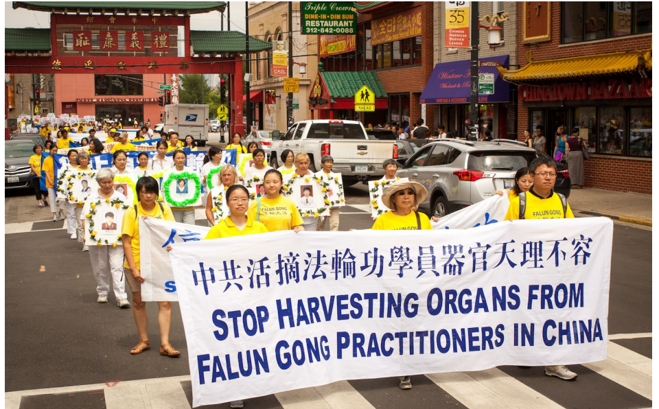
图：来自中部十个州的法轮功学员，齐聚芝加哥中国城举行盛大的游行。

随后的“声援三退”和“控告江泽民”方阵则以“声援 2 亿 4 千万人三退”“中共不等于中国 爱国不等于爱党”“法办迫害元凶江泽民”等横幅呼吁华人民众看清中共历史，摆脱中共思想奴役。数十个横幅与写有