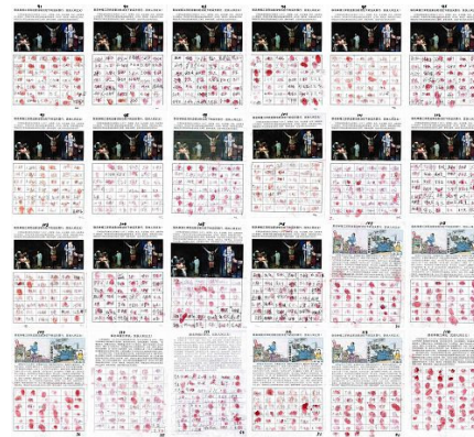
▲辽宁凌源民众联名举报江泽民