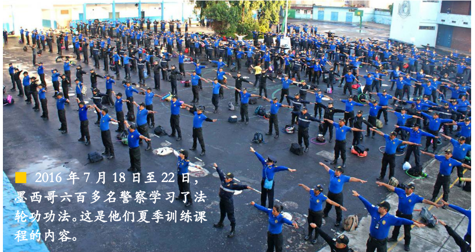
■ 2016 年 7 月 18 日至 22 日，墨西哥六百多名警察学习了法轮功功法。这是他们夏季训练课程的内容。

法轮功学员 2009 年 4 月 13 日下午受邀到印度首都德里警察训练大学介绍法轮功，该大学分男、女两个学院，三千多名学生现场学炼法轮功，场面壮观而祥和。（下图）