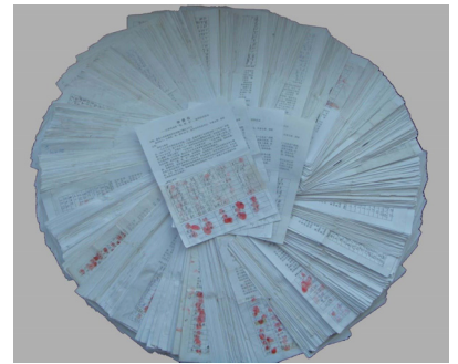
图：唐山 78361 名民众举报江泽民