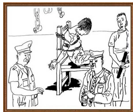
▲中共刑示意图：捆绑在椅子上

2015年，吕志范实名控告迫害法轮功的元凶江泽民。他在控告状中说：“我想做一个好人，却遭到江泽民流氓集团的打压，身体受到严重的摧残，亲人受牵连，美满的家庭被拆散。”◇