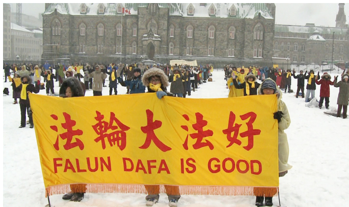
▲ 风雪中的“法轮大法好”（图为加拿大法轮功学员在国会山集体炼功。）

傲。在长达十七年的迫害中，千千万万的法轮功学员自始至终，至死不渝地捍卫着佛法真理，并怀着大善、大忍的心态，和平理性的反迫害，讲真相。他们历经风雨，辗转寒暑，冒着生命危险，不计个人得失，在迫害中年复一年，日复一日地采取各种方式向人们讲清真相，希望人们能分清善恶，不被中共谎言毒害，不被历史淘汰，最终能有个好的未来。越来越多的人从法轮功学员们的行为中见证了法轮大法的伟大和美好，明白了真相，因此站在了正义的一边，为自己选择了光明和未来。法轮功给人类带来了光明和希望。