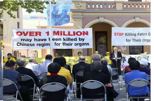
▲绿党候选人菲尔·布拉德利 (Phil Bradley) 在集会上发言