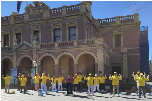
▲学员们在世纪广场展示功法