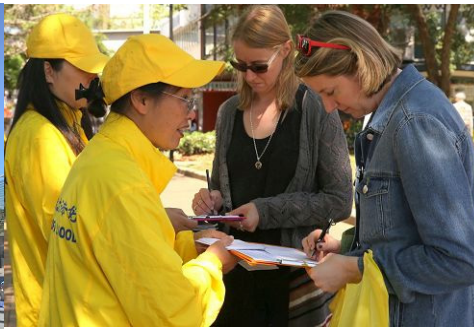
▲各界民众签名支持法轮功反迫害