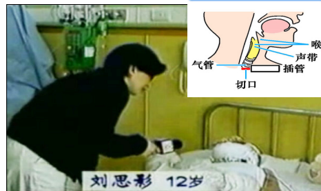
气管切开插管示意图

国际教育发展组织（IED）2001年8月14日在联合国会议上，就天安门自焚事件，强烈谴责中共的“国家恐怖主义行为”。声明说：从录像分析表明，整个事件是“政府一手导演的”。中国代表团面对确凿的证据，没有辩辞。该声明已被联合国备案。