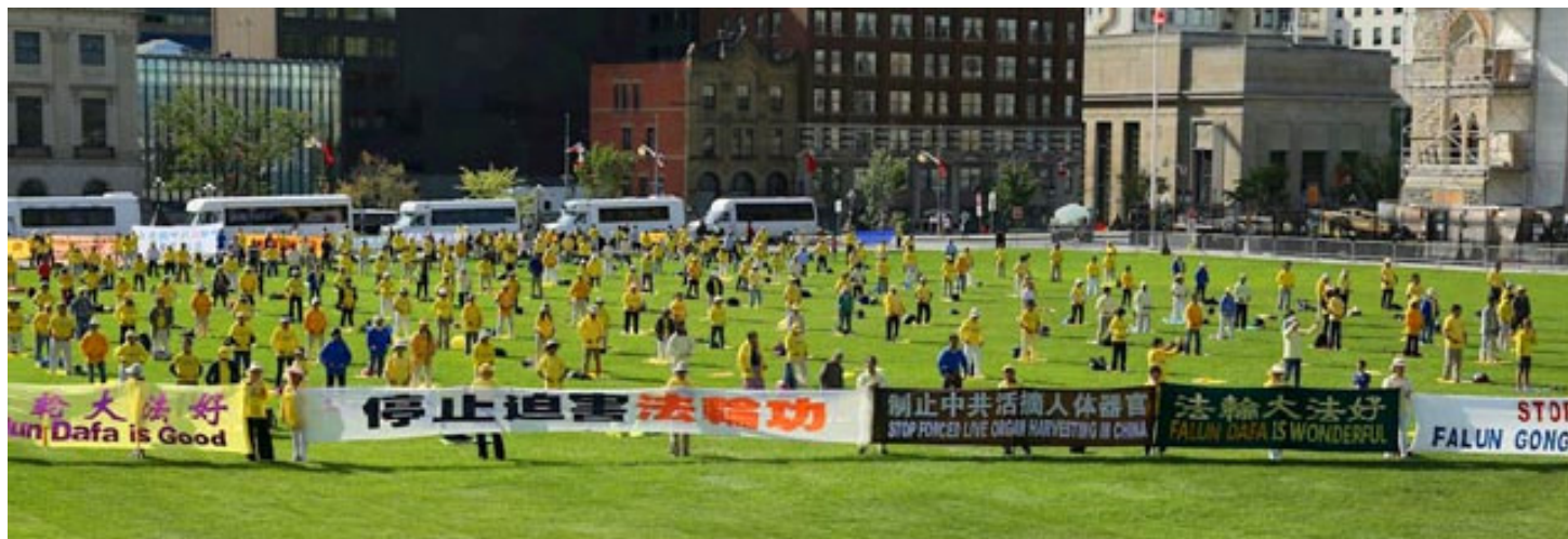
▲法轮功学员在加拿大国会山前炼功，并打出横幅，呼吁停止迫害。