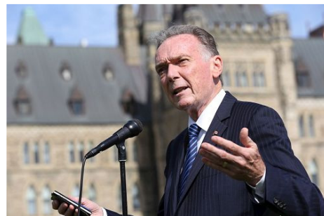
▲国会议员 Peter Kent 于九月二十二日现场支持法轮功，并在发言中敦促中国领导人法办江泽民。

和向中国民众讲法轮功被中共迫害的真相，都遭受过肉体和精神折磨。他们二零零四年就在加拿大以反人类罪控告了江泽民。