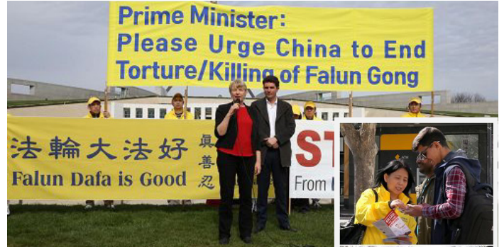
▲ 绿党西澳参议员斯科特·洛德兰姆（右）和维省参议员简内特·赖斯（左）在集会上都表示支持法轮功。（右图）民众参与征签活动。

她表示，自己是多年前，在维省马瑞博瑞市任市议员和市长期间，就从法轮功学员那里了解到在中国发生的法轮功学员被迫害以及活摘器官的事情。她说：