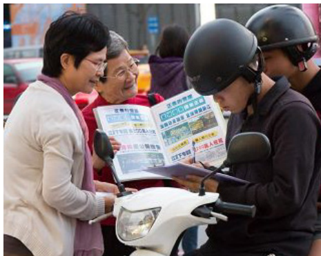
■ 年过八旬的洵姨（左二）每天在台湾旅游景点发传单、举真相展板，让游客明白“法轮大法好”。

一天，社区办公室发出通知：公园里免费教法轮功。洵姨来到公园，一炼法轮功就觉得全身舒畅，她想：这可是宝贝，可以救命。不到半年的时间，她双眼的黄斑病变消失了，不再需服用任何药物。老伴和子女非常支持她修炼。台湾景点有很多大陆游客，洵姨常年去那里举真相展板，让游客听闻“法轮大法好”的福音。◇