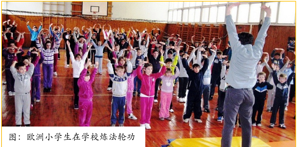
图：欧洲小学生在学校炼法轮功

在这个道德急速下滑的社会中，如何使自己的孩子健康成长，是每位家长关心的问题，现在作业本上都印着“远离毒品，不要吸毒”之类的标语，不知道这种标语是让家长放心呢，还是操心？