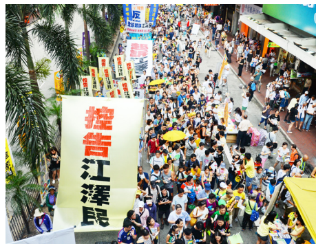
法轮功学员在香港游行，声援全球“诉江”大潮

迫害法轮功的罪魁祸首江泽民，在 1999 年时，曾叫嚣“三个月消灭法轮功”，下令对法轮功学员实行“名誉上搞臭”、“经济上截断”、“肉体上消灭”的灭绝政策。然而法轮功并没有被消灭，反而弘传世界 100 多个国家和地区。