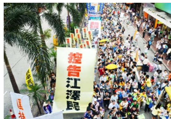
法轮功学员在香港游行，声援全球“诉江”大潮

迫害法轮功的罪魁祸首江泽民，在1999年时，曾叫嚣“三个月消灭法轮功”，下令对法轮功学员实行“名誉上搞臭”、“经济上截断”、“肉体上消灭”的灭绝政策。然而法轮功并没有被消灭，反而弘传世界100多个国家和地区。