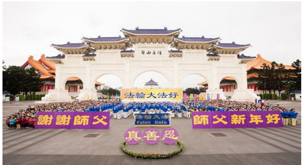
图：台湾双北地区近千名法轮功学员于二零一七年一月十五日在“自由广场”向法轮功创始人李洪志师父拜年，敬谢师恩。

担任教授助理的家聿说：修炼法轮大法之后头脑清晰条理分明，能够很从容地把功课做得很好，做事有效率之外，身心轻松自在，明白凡事尽力而为，没有得失心，因此在做报告时也显得很自然、很自信。同侪都知