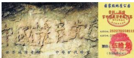
图：贵州平塘县掌布谷国家地质风景公园门票

不管中共怎样掩盖，明白人知道，天意就在眼前。中共几十年来靠谎言与暴力维持政权，通过政治运动败坏人心，摧毁传统