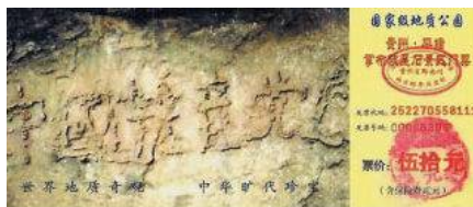
图：贵州平塘县掌布谷国家地质风景公园门票

不管中共怎样掩盖，明白人知道，天意就在眼前。中共几十年来靠谎言与暴力维持政权，通过政治运动败坏人心，摧毁传统