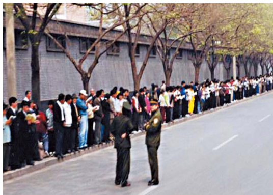
✴ “4·25”上访现场。法轮功学员安静有序，中央信访办周围街道秩序井然，警察在悠闲地聊天。

可是，“四·二五”当晚，江泽民出于妒忌，把和平上访歪曲成“围攻中南海”，并于1999年7月20日开始全面迫害法轮功。（四月正面图为法轮功学员绘画作品《春风送福万物新》，作品取材于明慧故事，展现的是法轮大法给小村带来一片祥和与喜悦。）