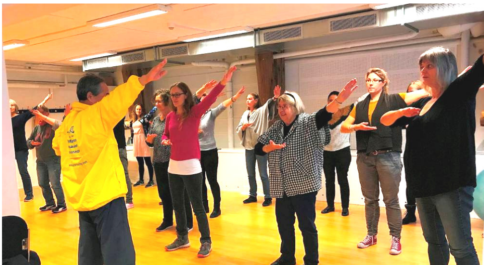
■在哥本哈根“神秘宇宙”博览会上，人们学炼法轮大法功法

一位女士路过法轮功展台时，看到桌子上摆放了不同真相资料，她问学员们，你们的活动经费从哪里来的？当她得知是法轮功学员拿出的个人收入来支付的，她感到非常惊讶。学员解释说：我们的师父免费把