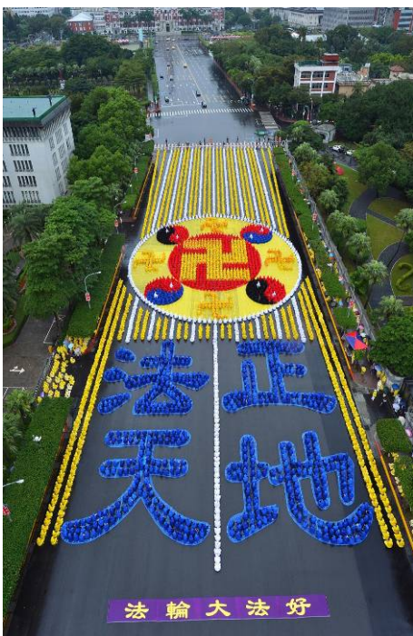
■2012年11月17日，6千名法轮功学员在台湾总统府前的广场排字

对于中国大陆法轮功学员惨遭无辜迫害，台湾与世界各地学员感同身受，经常举行大规模活动向各地民众讲述法轮功的真相，揭露中共邪恶迫害，启发人们的善念良知，呼吁各界人士共同制止这场残酷迫害。◇