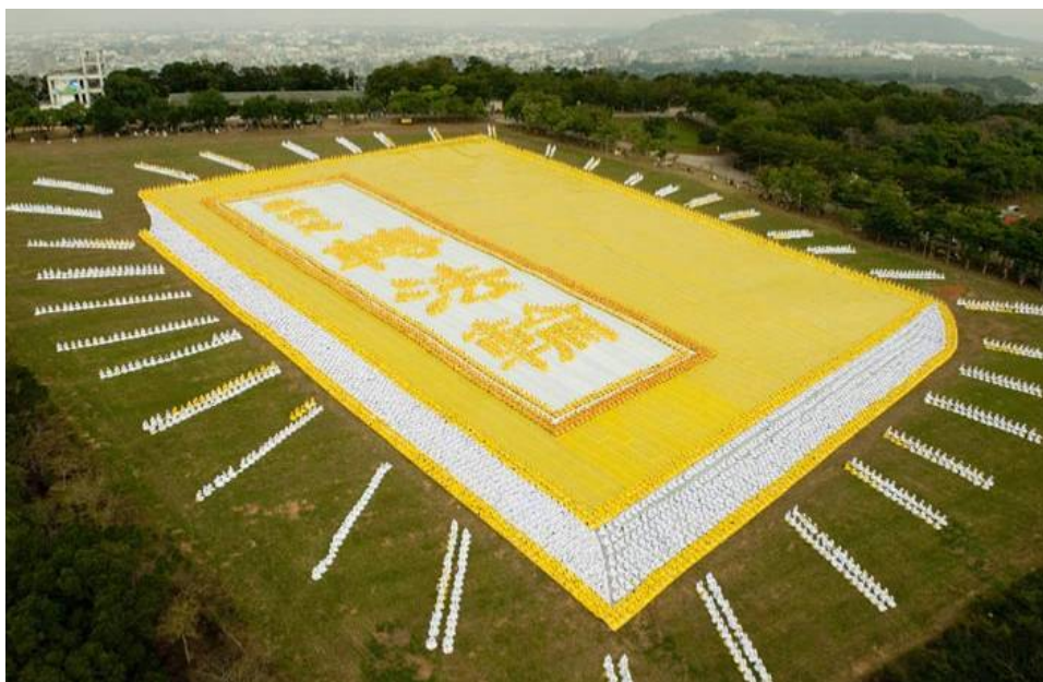
■2009年11月21日，6千名法轮功学员排成壮观的《转法轮》立体书图形

被法轮功学员尊称为师父的李洪志先生，是中国吉林省长春市人，1992年5月13日在长春市开办首期法轮功学习班，第一次向社会传授法轮