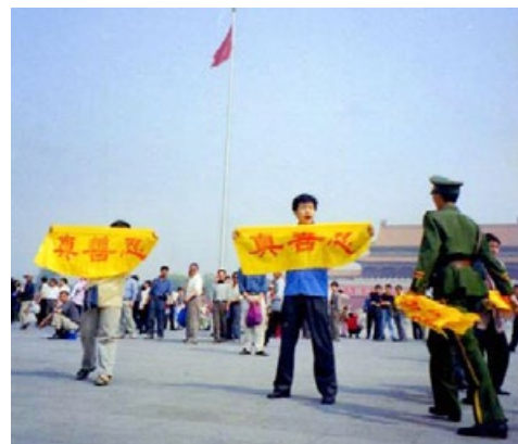
天安门广场一幕（2001年5月13日）

在法轮功被迫害初期，许多人到当地政府部门请愿。当他们看到低层地方官员毫无反应，就开始给更高层政府写信，或到北京请愿。到了2000年，几乎每天都