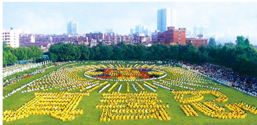
1997年，5000多名武汉法轮功学员炼功，列队组成法轮图形及“真善忍”。

1999年4月，政府对法轮功的骚扰加剧，天津几十名法轮功学员被殴打和逮捕，那些呼吁释放他们的法轮功学员被告知：命令来自北京。同年4月25日，一万多名法轮功学员安静地聚