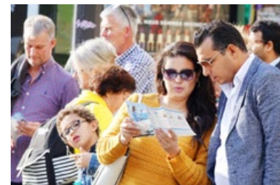
观众阅读法轮功真相资料