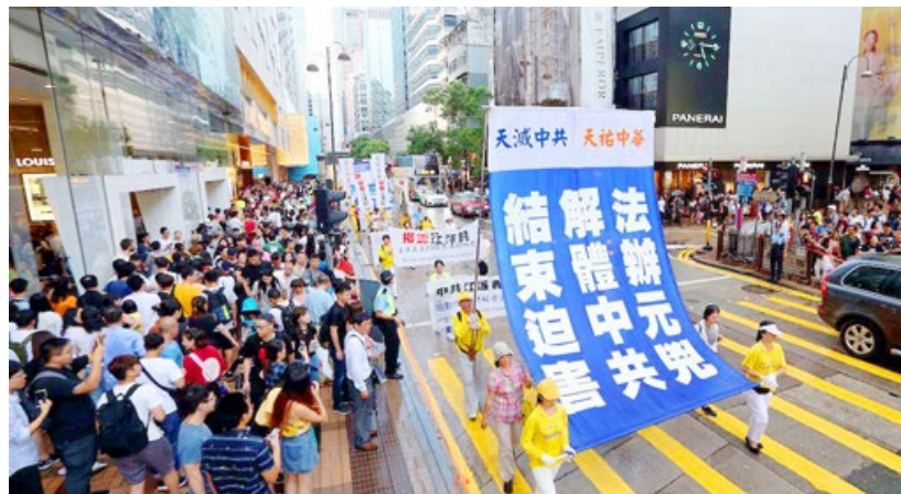
2017年10月1日，香港法轮功学员举行反迫害大游行。

大家希望我讲下去。我说：“希望过幸福生活、环境稳定，这无可厚非。但是在眼下的中国，这个美好愿望已被中共打破。原因如下：现政权想以反腐手段把党变好，而这个来自西方的