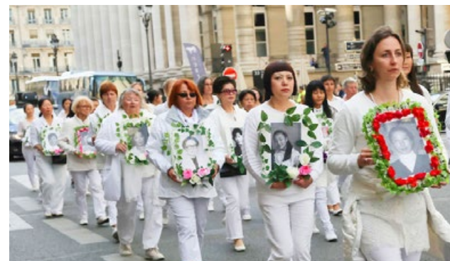
纪念被中共迫害致死的 4154 位中国大陆法轮功学员