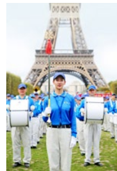
法轮功学员组成的天国乐团