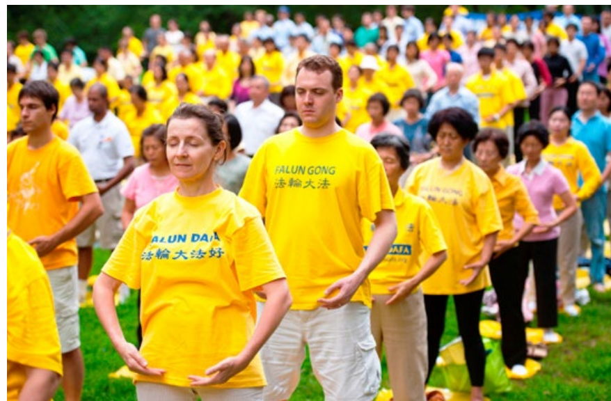
海外法轮功学员集体炼功

弘传世界 法轮大法已弘传 100 多个国家和地区，受到世界人民的爱戴和尊敬。李洪志先生和法轮大法因对人类身心健康做出的杰出贡献，获各国政府褒奖、支持议案和信函 3500 多项。法轮功书籍被译成 39 种语言在全球出版发行并可在法轮大法网站上免费下载。◇