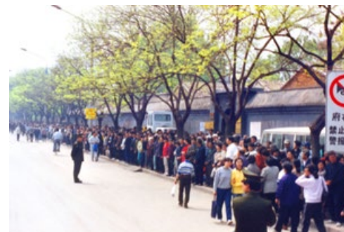
1999年4月25日，上万名法轮功学员和平上访，向当局反映法轮功的真实情况和发生在天津的公安暴力抓捕法轮功学员事件。整个上访过程秩序井然，法轮功学员离开后，地上无一片纸屑。有警察感慨地说：“看，这就是德！”

但是，时任国家主席的江泽民称法轮功对政权是严重挑战。在1999年6月7日的一份中共高层内部档案中，江泽民明确发出取缔法轮功的指示。这个决定非常突然，而且与国内安全情报部门的调查结论相悖。安全部门的调查结论是“法轮功不构成任何威胁”。