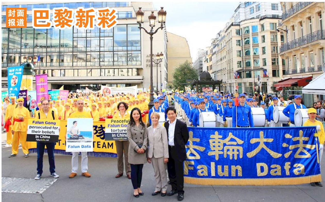
法国前部长奥斯塔丽女士（中）与法轮功学员合影