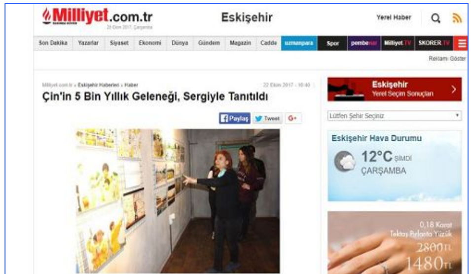
土耳其最著名的报纸 Milliyet 日报报道了照片展

图片展的第三天，IHA通讯社的记者采访了法轮功学员，并刊登了法轮功真相和中共迫害法轮功的文章。还有许多家报纸报道了图片展。土耳其最著名的报纸 Milliyet 日报也报道