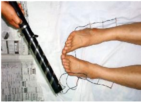
中共酷刑：电针电击