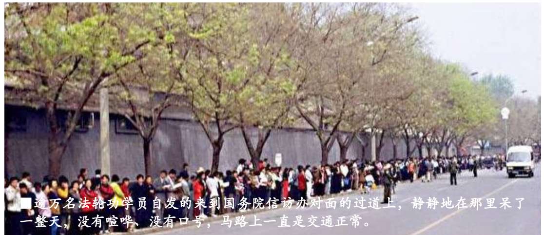
逾万名法轮功学员自发的来到国务院信访办对面的过道上，静静地在里面呆了一整天，没有喧哗、没有口号，马路上一直是交通正常。

1998年7月，公安部一局发出《关于对法轮功开展调查的通知》，《通知》采取了先定罪、后调查的程