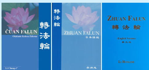
↑ 《转法轮》斯洛文尼亚文版、日文版、英文版封面

“天梯书店”有售：《转法轮》已被翻译成 40 种语言，是迄今为止翻译成外国语言文字最多的中文书籍，在世界各地的法轮大法书籍专营店“天梯书店”都可看到。