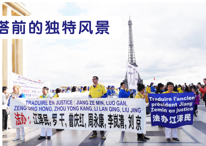
↑ 法轮功学员艾菲尔铁塔前集会