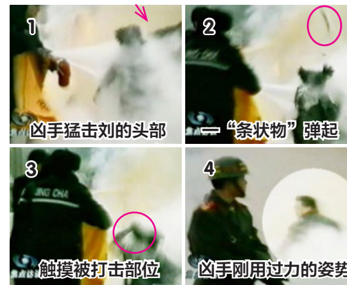
↑ 图为央视“焦点访谈”录像截图

央视称：刘春玲是被火烧死的。但央视录像表明：刘春玲是在自焚现场被人用重物击打脑部致死。