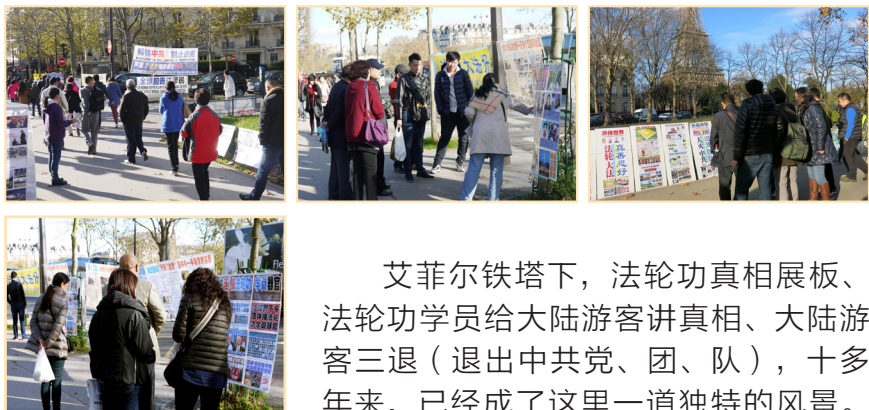
↑ 艾菲尔铁塔前的真相展板，游客或驻足观看，或听讲解。

艾菲尔铁塔下，法轮功真相展板、法轮功学员给大陆游客讲真相、大陆游客三退（退出中共党、团、队），十多年来，已经成了这里一道独特的风景。法轮功学员君女士每天都会来这里。