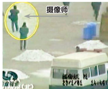
↑ 图为央视“焦点访谈”录像截图