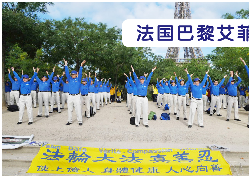
↑ 法轮功学员在艾菲尔铁塔前集体炼功