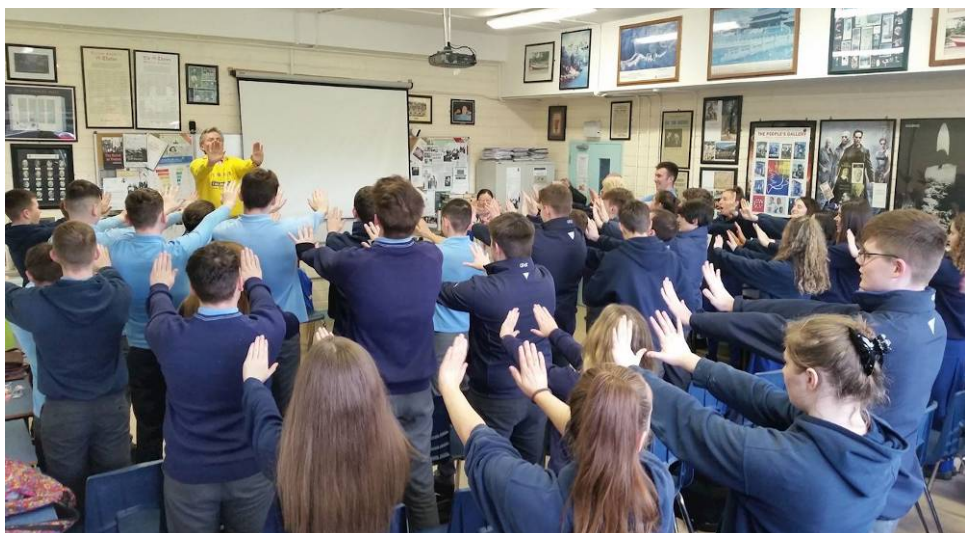
■爱尔兰都柏林一所中学即将参加高考的六年级学生们学炼法轮功

法轮功学员向学生们谈起自己的修炼体会，无论是修炼后身心健康的巨大改善，还是从修炼中获得了判