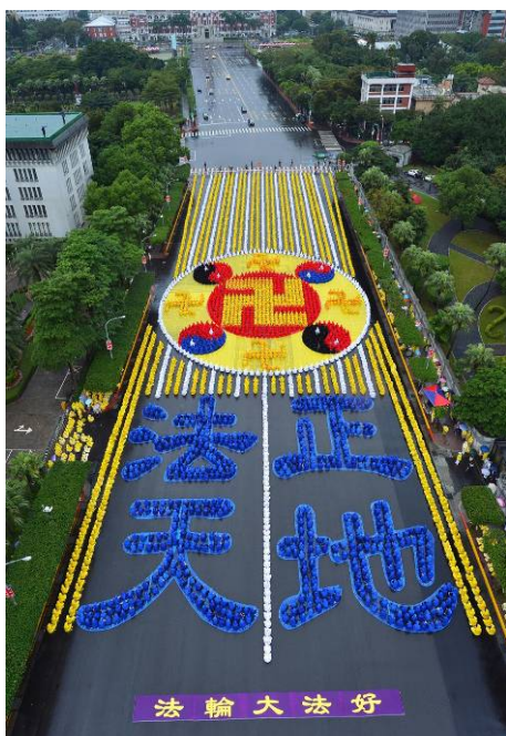
■ 2012 년 11 월 17 일, 6 천 명 파룬궁수련생이 총통 관저 앞 광장에서 새긴 배자

파룬궁은 1995 년 4 월에 대만에 전해진 후 줄곧 번영 발전하는 추세였다. 수련자 중에는 교수, 의사, 변호사, 엔지니어, 공무원, 군경, 교사와학생, 가정주부 등 다양한 계층이 있었다. (4 면에 계속)