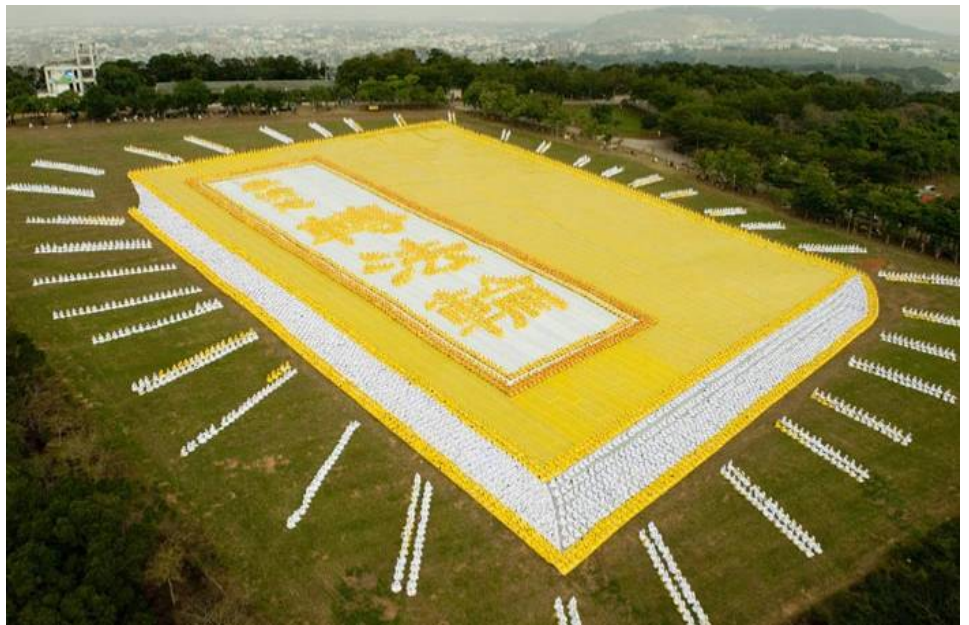
■ 2009 년 11 월 21 일, 6 천 명의 파룬궁수련생이 새긴 금빛 찬란한 ‘전법륜’ 입체 도형

1997 년 11 월 파룬궁 창시자 리홍쯔(李洪志) 선생님께서 대만에 오셔서 설법하시고 파룬따파가 대만에 널리 전해지는 데 견고한 초석을 다져놓으셨다. 20 년 동안 파룬궁수련생은 ‘진선인(眞·善·忍)’이 체현한 정신적 면모를 실천해 대만 사회에 참신하고 평온한 분위기를 가져다주었다. 올해는 마침 리홍쯔 사부님께서 파룬따파를 널리 전하신 지 25 주년이고 대만에 왕림하셔서 설법하신 지 20 주년이 되는 기쁨이 겹겹인 해이다. 이번 주 목요일 추수감사절을 맞으며 대만 파룬궁수련생은 사존께서 법