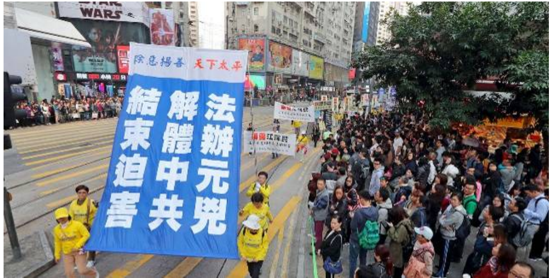
■ 法轮功学员的游行传达真相，呼吁解体中共、法办元凶、结束迫害。

全球退出中共服务中心主席易蓉透过网路发言指，2004 年《九评共产党》横空出世，引发 2.91 亿中华儿女退出中共党团队。时至今日，《九评》编辑部又发表了系列力作《共产主义的终极目的》，用触目惊心的事实揭露其目的就是要毁灭人类。只有退出中共，全面清除党文化，回归传统与善良，生命才有希望。