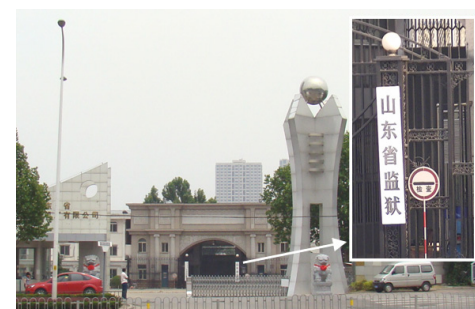
山东省监狱在济南市工业南路 91 号