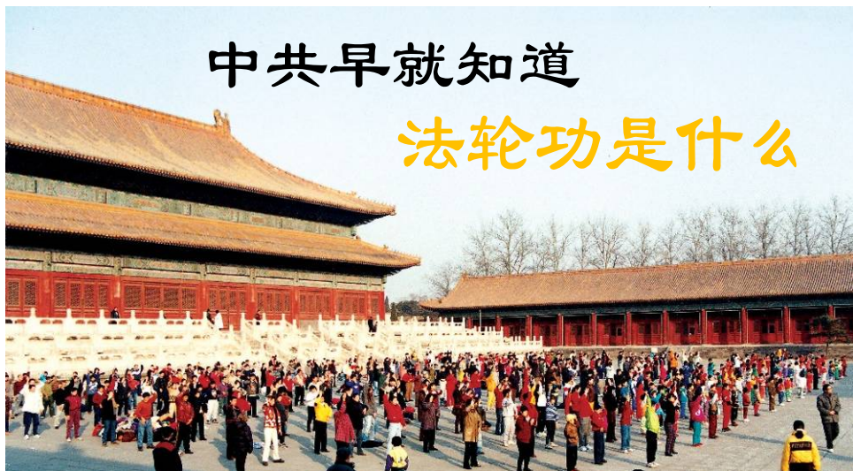
北京劳动人民文化宫的法轮功小学员炼功点（摄于1998年12月）

【明慧网】一直以来，外界有一种误解，认为江泽民开始迫害法轮功的时候，他对法轮功并不了解，中共高层也几乎对法轮功一无所知，这完全不符合事实。