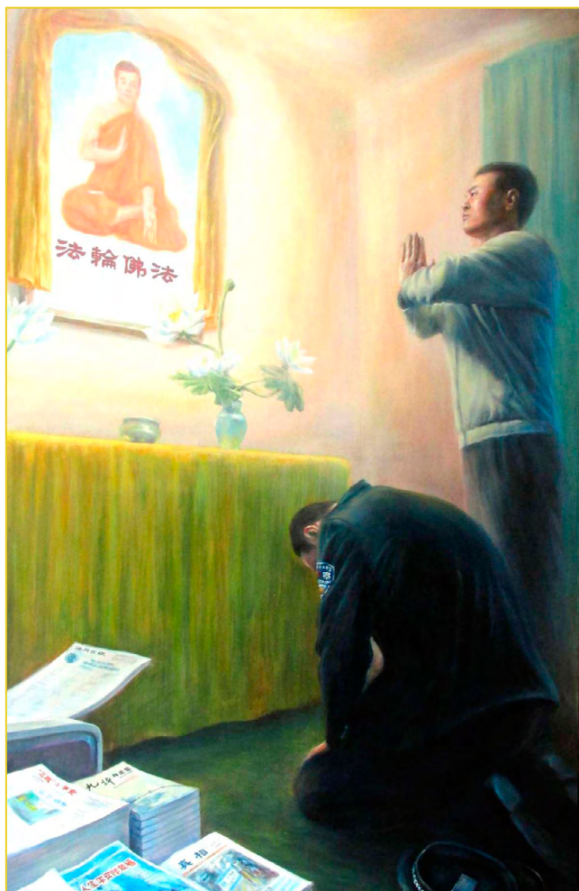
作者：中国西北地区法轮功学员 归真