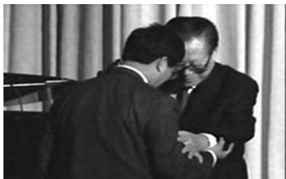
图：2002 年 10 月，江泽民以私人身份访美时，被法轮功学员在芝加哥以群体灭绝罪、酷刑罪、反人类罪告上法庭，江泽民接到控告状时惊慌失措。

2015 年 5 月 1 日，最高法院发布了“有案必立，有诉必理”新政后，全国已有二十多万（从 2015 年 5 月底到 2016 年 10 月 25 日，明慧网已收到总数 209908 名实名控告江泽民的诉讼状副本）名法轮功学员及家属将迫害元凶江泽民告向最高检察院、最高法院，诉状被两高签收，这为清算江泽民埋下伏笔。