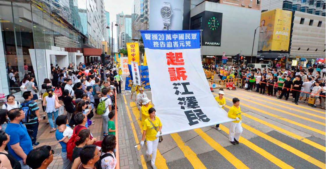
▲ 2016 年 5 月 8 日香港法轮功学员大游行。

与此同时，海内外各界民众纷纷以签名联署、游行集会等方式表达对控告江泽民的支持与声援。