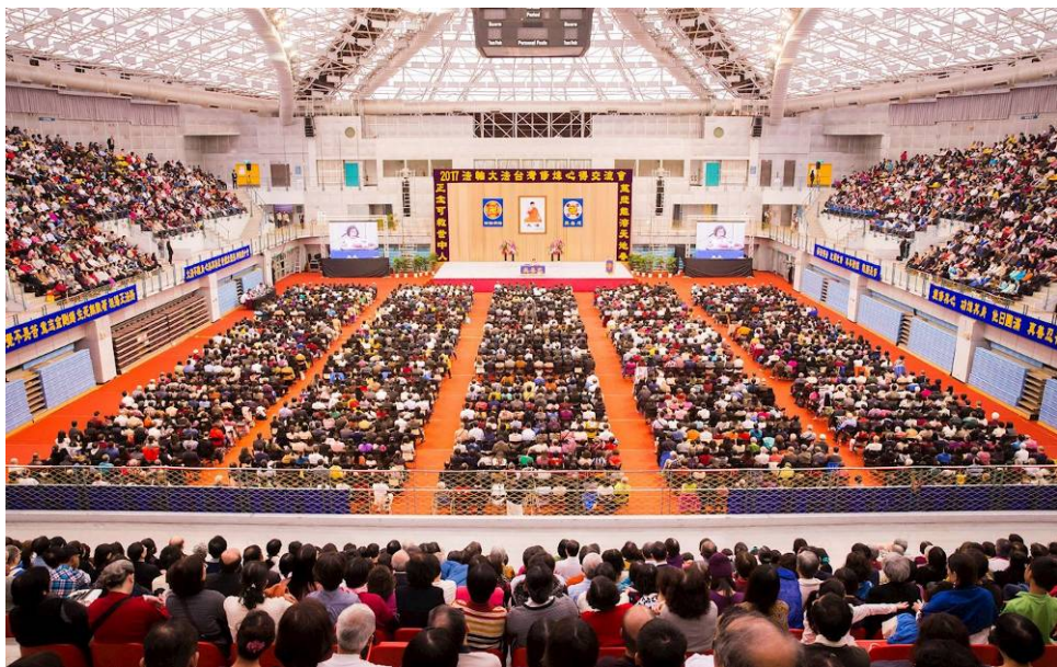
二零一七年台湾法轮大法修炼心得交流会在台湾大学体育馆隆重召开

目前任教于金门一所国小的胡女士，大学毕业后有幸找到真正可以帮助人的办法，就是鼓励对方修炼法轮功。2014年胡女士获选为金门县特殊优良教师，在上台受奖时，胡女士说：“我从害羞的天性到有勇气站在台上，全是因为我遇到了一位伟大的师父，他教我做人要无私无我、先他后我，他就是法轮大法的创始人李洪志老师，李老师，谢谢您！另外，我指导学生三度获得金门科学展览会物理科第一名，也全是因为修炼大法后用‘真、善、忍’的法理来要求自己、指导学生出现的奇迹。”