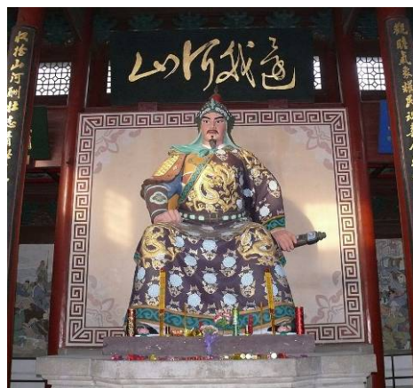
杭州岳王庙里供奉的岳飞像

绍兴三十二年(公元1162年)六月,由于金国海陵王挥师南下,重新燃起灭亡南宋的战火,南宋军民抗金呼声不断高涨,出于无奈,赵构将皇位让给了自己的养子赵昚,即宋孝宗。宋孝宗是个抗战派,为了顺应民心,激励军民的抗金斗志,他继位的第二个月,就下诏给岳飞等人平反昭雪,官府悬赏五百贯白银,寻找岳飞的遗骨,准备以礼安葬岳飞。七月十三日官府贴出告示,八天后,隗顺的儿子探得皇榜确定无疑,才将父亲密葬岳飞的真实地点,报告了官府,从