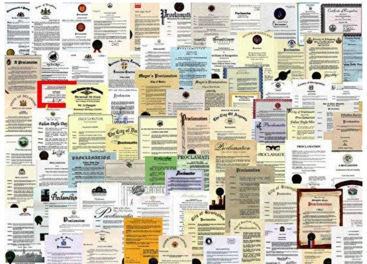
■ 美国各级政府、政要往年表彰法轮功的褒奖图片

纽约州国会议员杰弗里在贺信中说：“向法轮大法创始人和精神领袖——李洪志先生，以及世界各地的法轮功修炼者和支持者表示感谢”，并“感谢法轮功学员坚持不懈地在社区举办各种免费的教功活动，让社区里的民众能够参加这个祥和的修炼活动，帮助社区变得更加美好。”