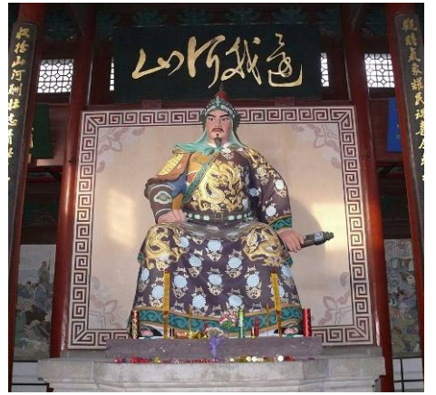
杭州岳王庙里供奉的岳飞像

绍兴三十二年(公元1162年)六月,由于金国海陵王挥师南下,重新燃起灭亡南宋的战火,南宋军民抗金呼声不断高涨,出于无奈,赵构将皇位让给了自己的养子赵昚,即宋孝宗。宋孝宗是个抗战派,为了顺应民心,激励军民的抗金斗志,他继位的第二个月,就下诏给岳飞等人平反昭雪,官府悬赏五百贯白银,寻找岳飞的遗骨,准备以礼安葬岳飞。七月十三日官府贴出告示,八天后,隗顺的儿子探得皇榜确定无疑,才将父亲密葬岳飞的真实地点,报告了官府,从