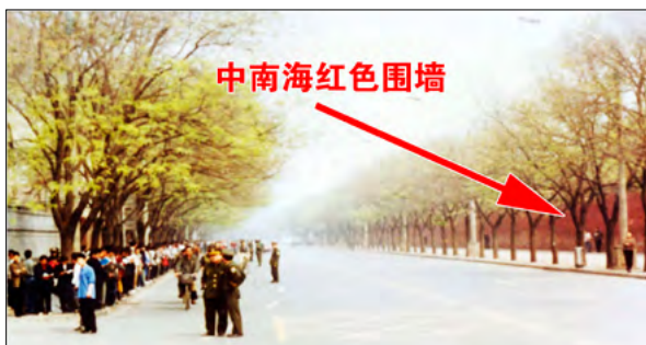
图：与上访群众隔街相望的才是中南海的红色围墙，以及中南海的西门。在央视播出的现场录像中，也没有出现示威中常见的情绪激动的人群，没有标语，也没有口号，很明显，上访群众没有“围”住中南海，更没有发生所谓“冲击”事件。中共官方所谓的“围攻中南海”的谎言不攻自破。

中共惯于“翻手为云，覆手为雨”，你不跟它整人害人，它说你不关心政治；它撒谎，你揭露它，它整你；它诽谤，你去澄清时，它