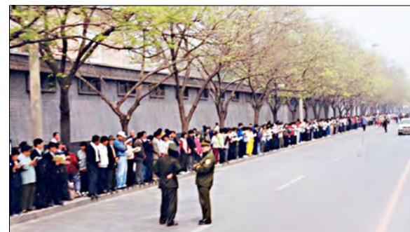
图：1999年4月25日法轮功学员和平上访，整个上访过程秩序良好，交通井然。

出于对政府的信任，法轮功学员4月25日依照宪法赋予的权利来到国务院信访局（中南海旁边）和平上访，希望释放天津学员，给法轮功学员一个宽松的修炼环境。当日，在国务院总理朱镕基的关注下，