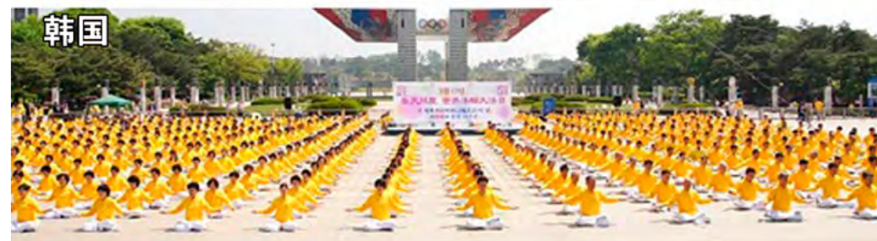
■ 法轮功已弘传世界一百多个国家和地区