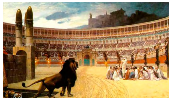
图:《基督殉道者最后的祈祷》: 竞技场周围的柱子上, 左边是遭受火刑的基督徒, 右边是十字架处死的基督徒, 中间一群基督徒则将被猛兽撕碎, 看台上无数民众毫无同情心地观看着这惨烈的情景。

公元 33 年基督耶稣受难之后, 基督徒在古罗马遭受残酷迫害。公元 64 年古罗马暴君尼禄故意纵火焚烧罗马城, 嫁祸于基督徒。为了进一步煽起人民对基督徒的仇恨, 一些官方学者把基督徒描绘为迷信、反社会、反人类, 有政治野心, 基督徒只要不放弃信仰就将失去财产, 沦为奴隶, 失去生命。统治者把基督徒和干草绑在一起点着, 或把他们扔到竞技场喂狮子, 而许多民众以此为乐。