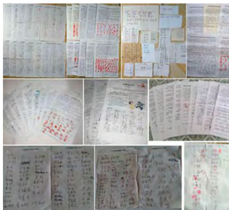
图：河北廊坊从 2015 年 9 月到 2016 年 10 月至少有 14813 人签名举报江泽民或签名支持控告江泽民，上图是部分签名。

听到法轮功学员起诉江泽民（简称：诉江）的消息，中国大陆民众振奋不已，许多民众都在等着审判恶首江泽民的那一天。他们说：“你们真是在为民除害。江泽民迫害法轮功，养了一帮一帮的贪官，没干一件好事。早该抓他了！”