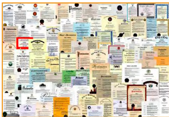
■ 法轮功获得的部分褒奖

法轮功迄今获得各界褒奖 1936 项、支持议案 392 件、支持信函 1200 封。近十几年，每逢 5 月 13 日“世界法轮大法日”，在北美洲、欧洲、澳洲至少上百位政要，包括总理、市长、州长、议员，为法轮大法颁发褒奖。以表彰法轮大法对人身心、对社会做出的突出贡献。