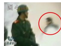
图 4 凶手打过人的姿势

中共称：刘春玲是在自焚中被火烧死的。但央视录像表明：刘春玲是在自焚现场被人用物体重击头部致死。