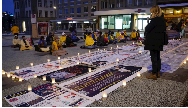
■ 瑞士法轮功学员在寒冬烛光守夜,要求制止中共迫害法轮功及活摘法轮功学员器官的罪行

法轮功学员表示:“习近平来访瑞士之前,我们希望能够让更多人来关注、制止中共对法轮功的迫害以及活摘法轮功学员器官的暴行。同时也希望能够让习近平知道,已有二十多万法轮功修炼者和家人提交了控告元凶江泽民的刑事控告状,在瑞士,在世界各地不断有人签名