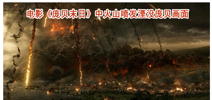
电影《庞贝末日》中火山喷发湮没庞贝画面

那么，用“善恶有报”的天理来衡量一下庞贝的“七宗罪”，灰埋庞贝是偶然的吗？用“善恶有报”的天理来衡量一下中共统治下的当今中国社会，恶党、恶政、恶法、恶官、恶