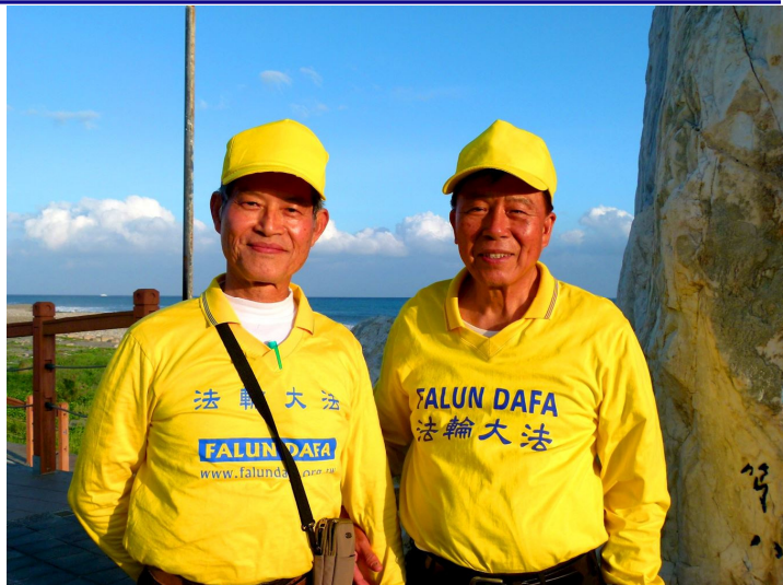
■ 林先生（右）和郑先生表示，修炼法轮功让他们明白了生命的意义

郑先生除了每天到景点，也坚持长期写信向大陆民众讲法轮功真相，他说：“我是自费做我应该要做的。”