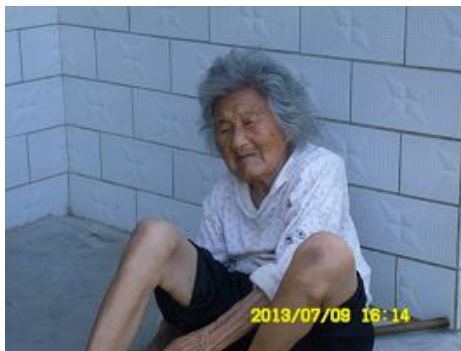
图: 九旬老母盼儿归

老人去世当天从上午九点多直到下午四点多钟胸口还是热的, 满屋的人都落泪了, 谁都知道她不想走