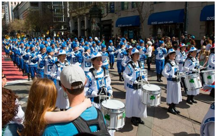
图：法轮功学员的队伍受到欢迎