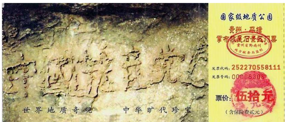
图：贵州省将平塘县藏字石建成国家级地质公园，图为公园门票，大石头上二亿七千万年前天然形成的“中国共产党亡”六个大字历历可观。

命悬一线，生死一念。真心盼望您早一天明白真相，早一天登上当代诺亚方舟，躲过日益逼近的生死劫难。◇（文/掸红尘）