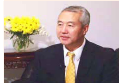
▲원 하버드 학자 왕즈위안 선생

2014년 “빙통(冰桶) 도전” 이란 이름을 가진 자선활동이 신속히 전세계를 풍미하면서 각계 유명 인사와 보통 백성을 흡인하였다. “빙통 도전”은 세계 여러 큰 매체의 화제로 보도되었고 사람들의 마음은 그속의 선심과 사랑의 뜻에 기울어지면서 날로 쓸쓸해지는 이 물질화의 세계에 따사로움을 가져다 주었다.