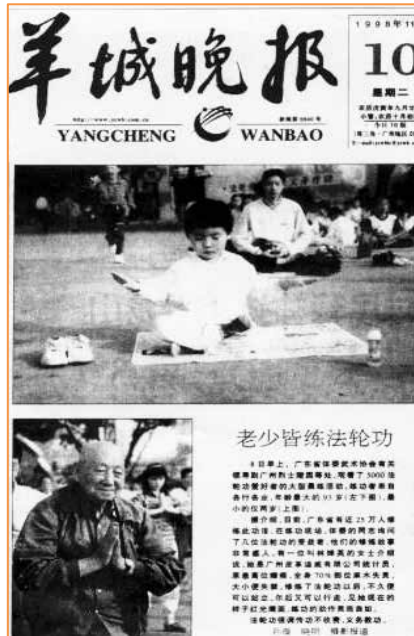
▲ 《양성완보》는: 로소 모두 파룬궁을 수련한다는 문장을 실었다.