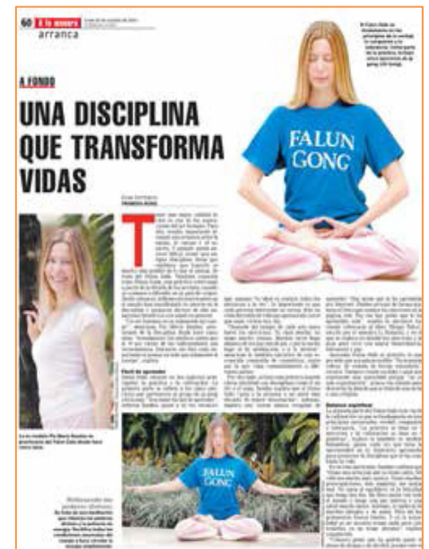
▲ 칠레 제일 큰 신문 《최신신문》에서 신기한 파룬따파를 소개하였다.