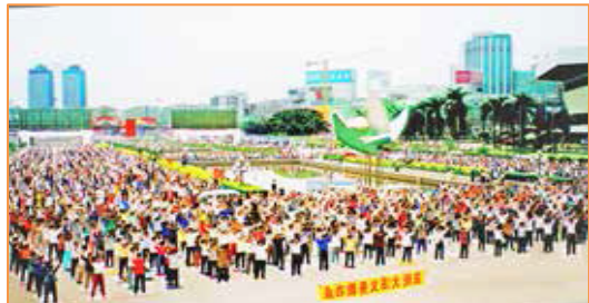
▲ 1998년 중국 광주시 한련공점의 파룬궁 수련생들의 아침련공. 광주 텔레비전 방송국에서 보도.