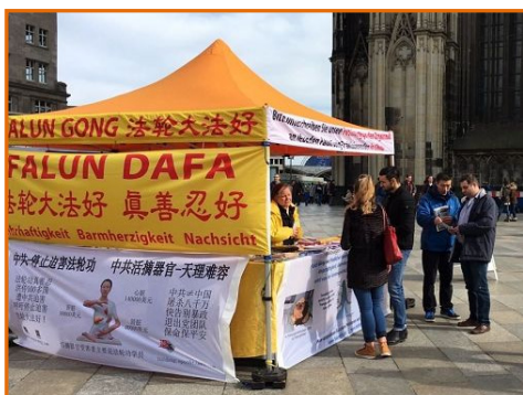
▲德国科隆大教堂门口,各国游客驻足签名支持法轮功学员反迫害

总部设在华盛顿的“自由之家”是在民主、自由、人权的研究和推广方面最主要的智库之一，其每年发布的报告具有相当的权威性。“自由之家”创立于 1941 年，罗斯福总统的夫人伊莉娜·罗斯福是创立者之一。◇