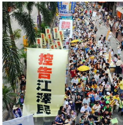
■ 2015年7月，香港民众大游行中“控告江泽民”的巨型标语。