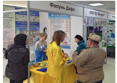
►右图：美丽健康展上，参观者详细了解法轮功功法。