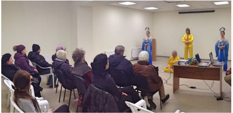
▲上图：美丽健康展上，法轮功学员演示功法。

当主持人讲述到在中国发生的中共对法轮功学员的非法迫害后，观众们提出了一些问题，学员一一解答。明白真相后，人们纷纷表示支持法轮功，并且感谢学员们告诉他们这些真相。展会上其他的参展者也来到法轮功学员的展位前攀谈，表示非常支持法轮功。◇