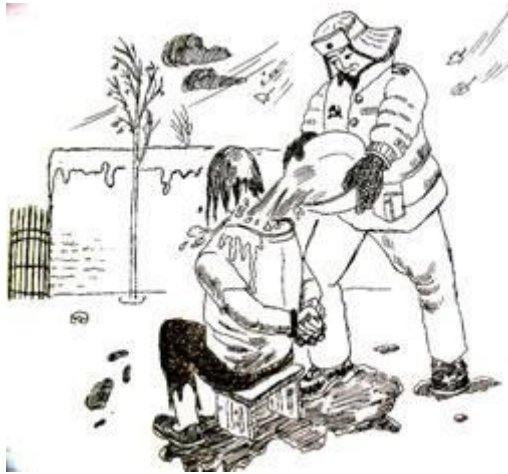
中共酷刑示意图：浇凉水

2002年遭绑架，在丹东市浪头派出所，他们七八个警察将我强行双手用手铐吊挂到派出所的铁笼子上。双臂各挂一个轮胎，头戴一个铁帽子，同时不停地用电棍电击我的脖子，双臂，腋下，当时脖子都是水泡，