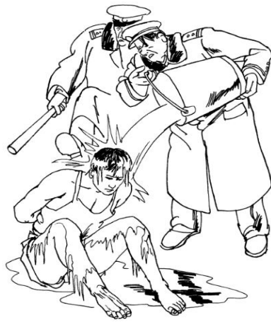
酷刑示意图：浇凉水 逢生，柳暗花明。

1998年，我非常幸运修炼了法轮功，我的身心发生了巨大的变化，简直就是脱胎换骨。我身体的所有病症没有了，无病一身轻，脸色不再是苍白、蜡黄的了，神清气爽，精力充沛。一个等死的因工伤残的废人起死回生了。我身体好了，可以正常打工了，生活也改善了。真是修大法绝处