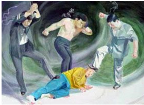
■ 中共酷刑示意图：野蛮殴打

然而皮鞭、棍棒并没有丝毫动摇他对“真、善、忍”的信仰，他以绝食的方式来反迫害。监狱人员对他多