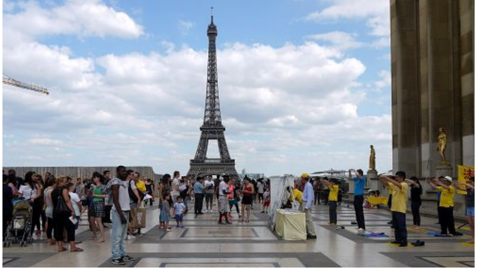
■ 法轮功学员在著名的埃菲尔铁塔旁的人权广场上炼功、讲真相

我继续给他讲真相，讲完后，他哽咽着说：我全明白了。我是学者，我写过书，发表过文章，都是歌功颂德，写我自己的感慨，实话实说的他们不给发表，我已不写了。共产党历次所犯的罪我清楚得很。今天，我所见到的、听到的，触动我的心。我有几句话，请你捎给你这里的同伴。“你们的辛苦、你们的委屈、你们所被侮辱、被打压，不会白付出。这是你们的功德，天地皆知。法轮功这么大一