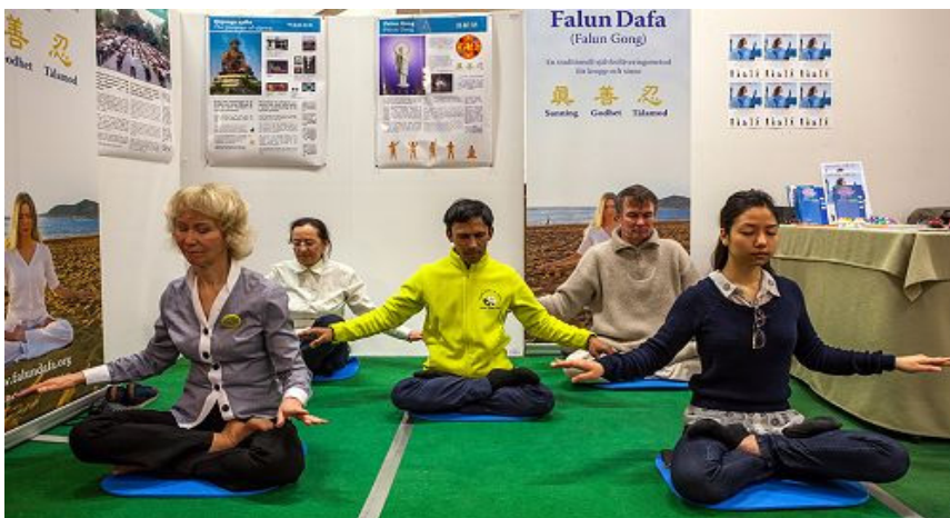
图：展会期间，法轮功学员们伴随着优美的炼功音乐在展示法轮功的五套功法。

健康展也吸引了很多来自瑞典外城市的人，有两位来自 Gävle 的瑞典女士还是第一次听说法轮功，看到这么如此祥和的功法很感兴趣，马上就要学功。得知法轮功炼功点已遍布在瑞典各地，她们所居住的城市里就有炼功点时非常的高兴，表示回去后会尽快联系当地的炼功点去学功。◇