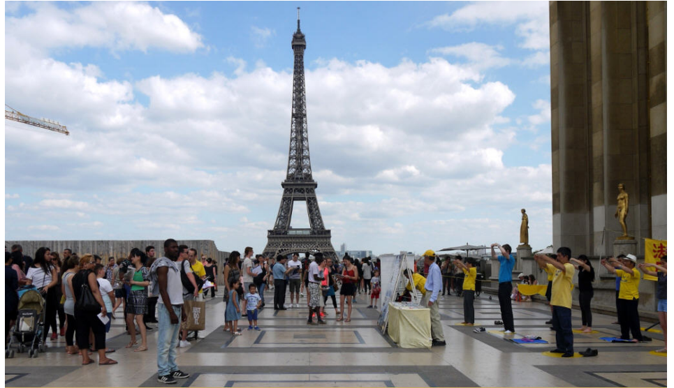
图：7月24日，法轮功学员在埃菲尔铁塔旁的人权广场上炼功、讲真相

我说：“法轮功是佛家上乘高德大法，是修真、善、忍的。我们每天来讲真相分文不取，只是积德、行善、救人。贵州省平塘县掌布乡，有一块