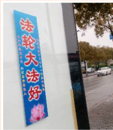
左图：上海街头的法轮功标语